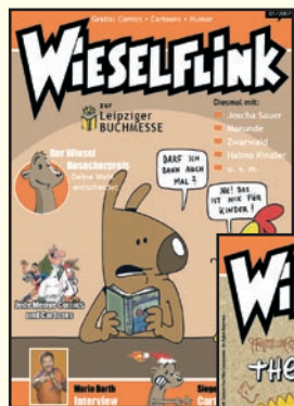
Ausgabe zur Leipziger Buchmesse Nr. 01/2007