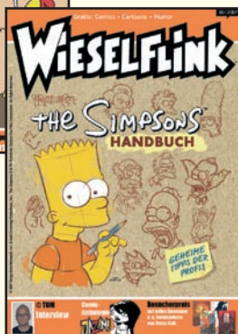
Ausgabe zur Frankfurter Buchmesse Nr. 02/2007